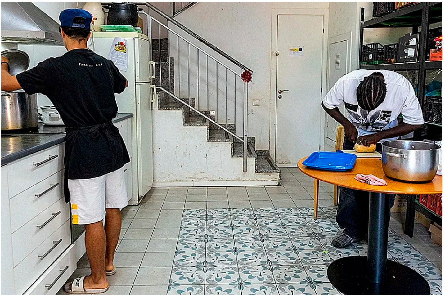
Dos de los jóvenes que viven en la casa de Vallcarca de BarcelonActua. ENRIC RACÓ ARABA PRESS